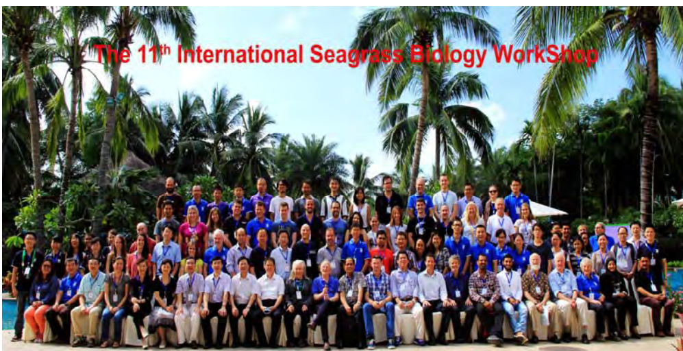
第 11 回国際海草生態ワークショップの参加者

今回のワークショップは「地球が変化する中で減少していく海草」をメインテーマに、世界中の専門家が