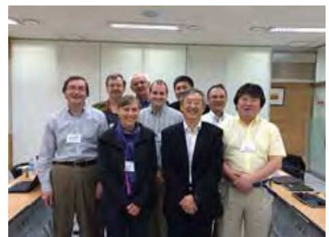
研究部会のメンバー

数多くのプログラムの中でも特に NOWPAP に関連するものを次ページで紹介します。