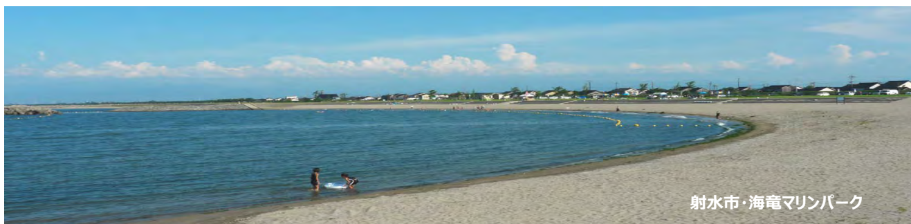
射水市・海竜マリンパーク

このニュースレターでは、2014 年の活動についてまとめています。ぜひとも特殊モニタリング・沿岸環境評価地域活動センター、「CEARAC」の活動を知っていただき、また、それを通じて富山湾から広く環日本海に関心を持っていただければ幸いです。今後とも本センターとともに環日本海的环境保全にご理解、ご協力いただけますようお願い申し上げます。