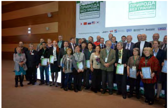
第 8 回国境なき自然国際環境フォーラムの発表者

による北西太平洋地域における富栄養化の予備評価」と題する発表を行い、衛星データを解析した結果クロロフィル a 濃度の増加が見られたことから、黄海で富栄養化が起こっている可能性があることを示しました。