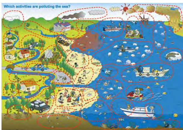
海洋ゴミ発生源を示したイラスト

地域拠点では市民/草の根レベルで海洋ゴミへの取り組みが活発化し、有効なゴミ対策に関してメンバー国間で広く情報交換が図られることを目指しています。