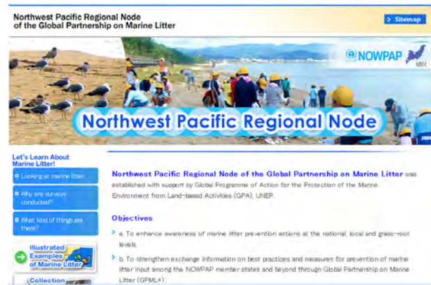
ウェブサイトのトップページ

( http://www.npec.or.jp/NWPacific_node/ )